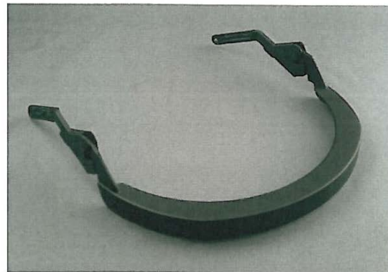
Safe 2 visor carrier Standard Low Peak 20901-010

Fín del certificabo de exámen EC 11297BES01