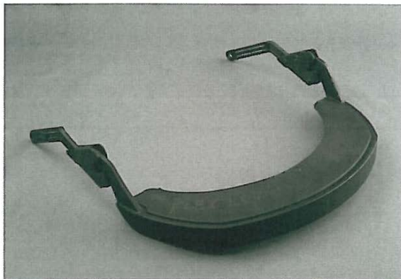
Safe 2 visor carrier FLEX Low Peak 20901-510