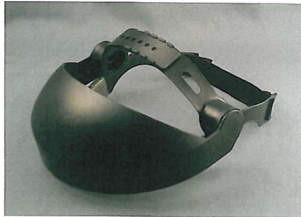
Safe 3 browguard 61100